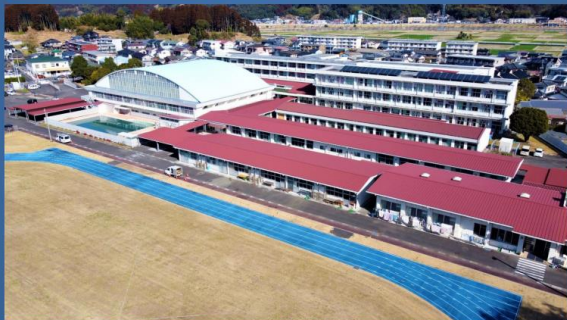
宮崎県立延岡しろやま支援学校 聴覚障がい教育部門

令和5年度 共に学び、生きる共生社会コンファレンス ひなたのつどい「取組推進校発表」